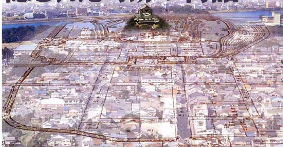
※江戸時代の町割り（町割）と現在の町割りを重ね合わせた図